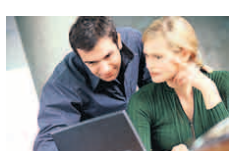
Spiel mit offenen Karten – das zeichnet auch Unternehmen aus