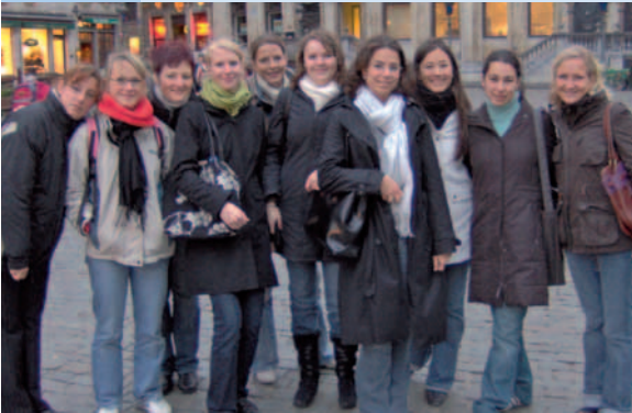
Studentinnen des Jahrgangs 2004 während der Studienexkursion nach Brüssel