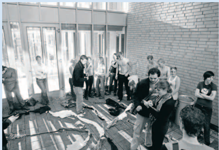
Wettbewerb: Welche Gruppe schafft die längste Kleiderkette?