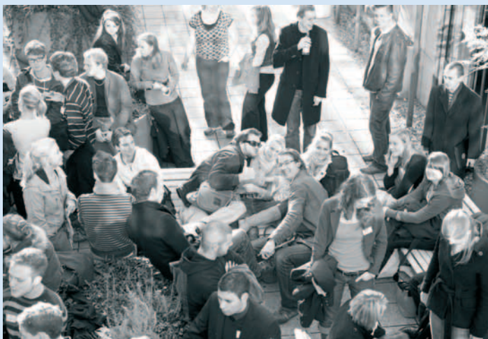
Networking auf dem Campus der HSBA