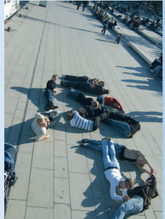
Darstellung der Buchstaben H-S-B-A auf dem Jungfernstieg

tränk und etwas Süßem zusammenzustellen. Zur Förderung der Identifikation mit der HSBA sollen die Gruppen schließlich die Buchstaben H-S-B-A auf dem Jungfernstieg formen, was ziemlich viele Blicke auf sich zieht. So macht man die HSBA bekannt! Zum großen Finale in der HSBA müssen sich die neuen Studierenden noch einigen weiteren Herausforderungen stellen, wie zum Beispiel der pantomimischen Darstellung des Begriffs „Alkopop“. Der Einfallsreichtum sorgt hier für viele Lacher. Nachdem die Sie-