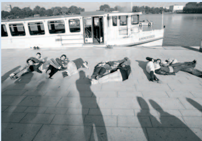
HSBA-Buchstaben auf dem Jungfernstieg

Dazu müssen verschiedene Stationen durchlaufen werden. In der Thalia Buchhandlung muss zum Beispiel die BWL-Bibel von Günter Wöhe gefunden und von der ganzen Gruppe der letzte Satz eines bestimmten Kapitels auswendig aufgesagt werden. Allerdings führen die vielen Kapitel des Wälzers und die entsprechend vielen letzten Sätze offensichtlich zu Verwirrung. In manchen Gruppen wird zwar artig ein Satz aufgesagt, allerdings nicht der gesuchte. Einfacher ist da die Aufgabe, im Schlemmermarkt möglichst schnell ein Menü für drei Euro aus einer warmen Mahlzeit, einem Ge-